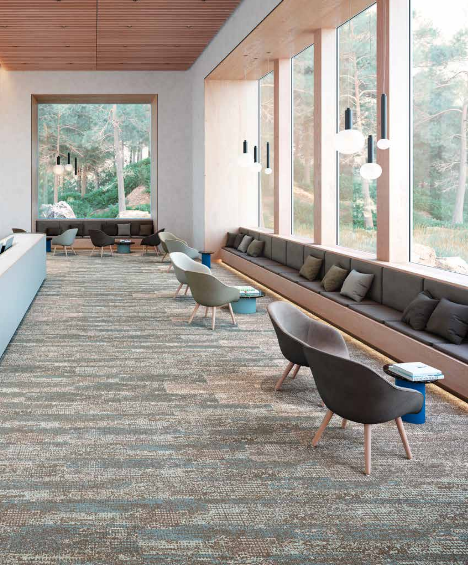
RESPOND (5T363) IN MOUNTAIN (05761) + RESPOND COLOUR (5T366) IN MOUNTAIN LAKE (05327) / INSTALLED BRICK | INSTALLÉ COUPE DE PIERRE | GEÏNSTALLEERD STEEN | VERLEGT RICHTUNGSGLEICH MIT VERSATZ