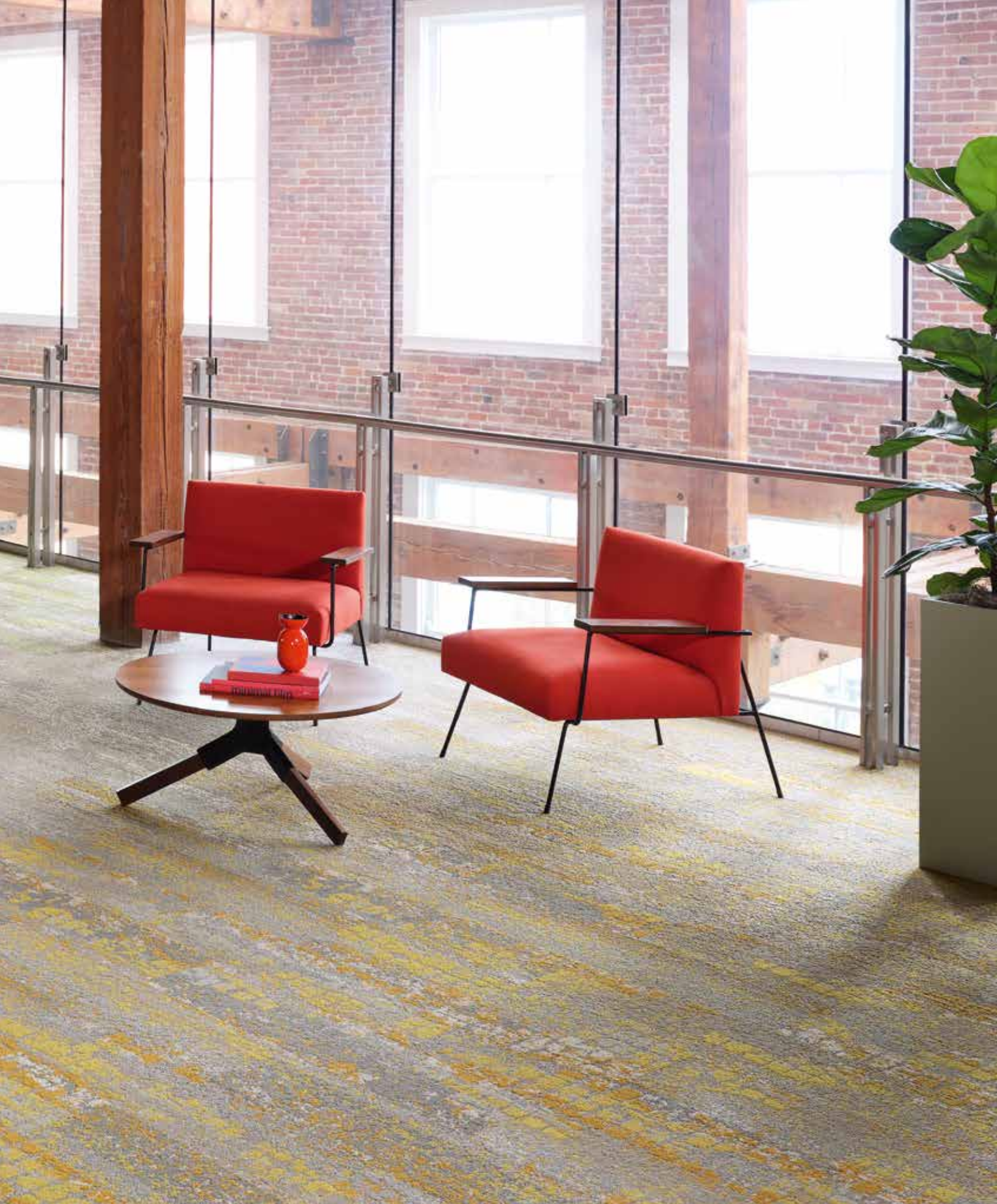
TRANSFORM COLOUR (5T368) IN OPTIMISTIC OCHRE (05225) + OBSERVE COLOUR (5T367) IN OPTIMISTIC OCHRE (05225) + OBSERVE (5T364) IN OPTIMISTIC (05105) + TRANSFORM COLOUR (5T368) IN RADIANT NATURE (05326) + OBSERVE COLOUR (5T367) IN RADIANT NATURE (05326) / INSTALLED BRICK | INSTALLÉ COUPE DE PIERRE | GEÏNSTALLEERD STEEN | VERLEGT RICHTUNGSGLEICH MIT VERSATZ