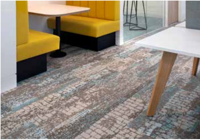
TRANSFORM COLOUR (5T368) IN MOUNTAIN LAKE (05327) / INSTALLED ASHLAR | INSTALLÉ RECOUVREMENT | GEÏNSTALLEERD ASHLAR | VERLEGT IN RICHTUNGSGLEICH MIT VERSATZ MEETING ROOM | SALLE DE RÉUNION | VERGADERZAAL | MEETINGRAUM: ENDLESS (5T362) IN LAKE (05327) / INSTALLED ASHLAR | INSTALLÉ RECOUVREMENT | GEÏNSTALLEERD ASHLAR | VERLEGT IN RICHTUNGSGLEICH MIT VERSATZ