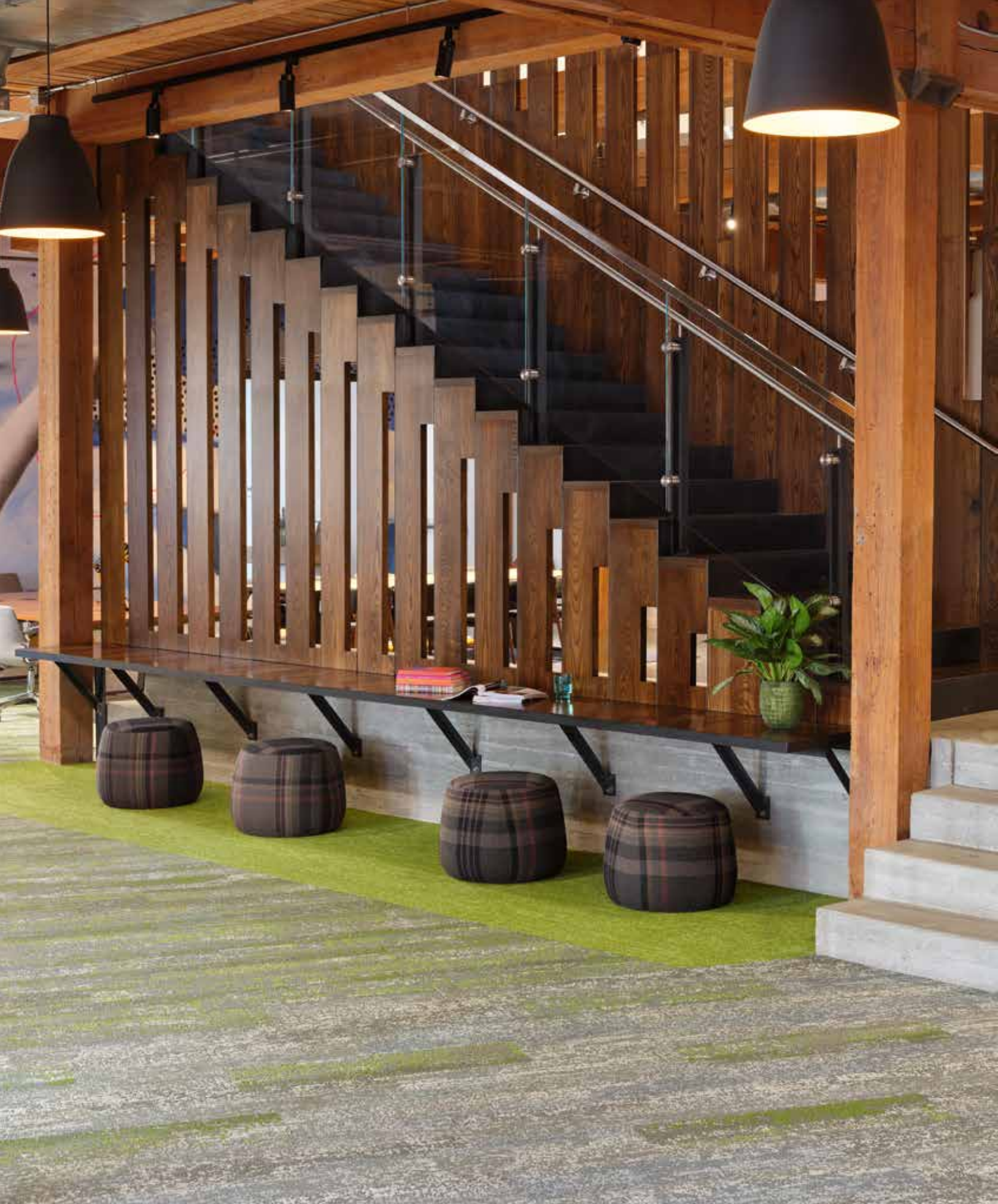
OBSERVE (5T364) IN RADIANT (05515) + OBSERVE COLOUR (5T367) IN RADIANT NATURE (05326) / INSTALLED BRICK | INSTALLÉ COUPE DE PIERRE | GEÏNSTALLEERD STEEN | VERLEGT RICHTUNGSGLEICH MIT VERSATZ + ENDLESS (5T362) IN NATURE (05326) / INSTALLED MONOLITHIC | INSTALLÉ MONOLITHIQUE | GEÏNSTALLEERD KAMERBREED | VERLEGT RICHTUNGSGLEICH OHNE VERSATZ