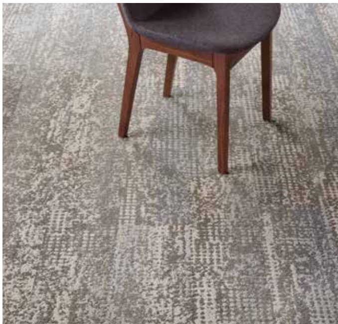
RESPOND (5T363) IN RADIANT (05515) / INSTALLED ASHLAR | INSTALLÉ RECOUVREMENT | GEÏNSTALLEERD ASHLAR | VERLEGT IN RICHTUNGSGLEICH MIT VERSATZ